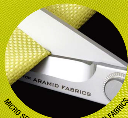
MICRO SERRATED EDGE FOR ARAMID FABRICS